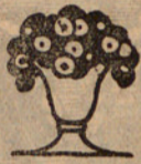
Lletra del Rnd. Francesc de P. Girbau, Pvre.