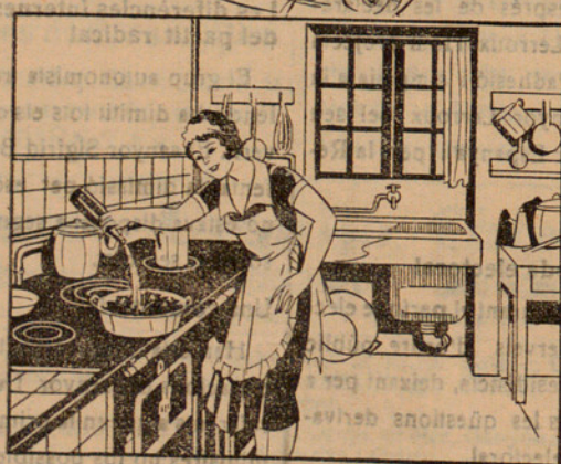
Amb la solució preparada multo 15 quilos de carbó que abans hauré posat en un cubell, fins que quedí ben mullat. ¡Quèstió d'un minut!