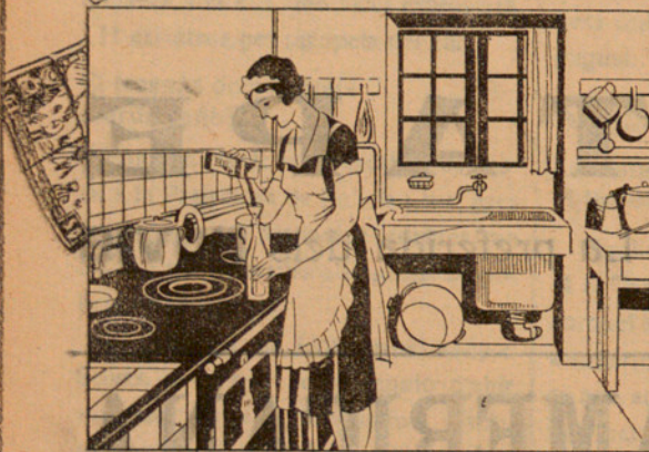
En una botella de litre plena d'aigua, hi poso dues cullerades de Oxigenante de Carbones i remeno la botella... ¡JA ESTA!

Vegi gràficament la manera senzilla i pràctica de preparar el carbó, només un minut cada dia