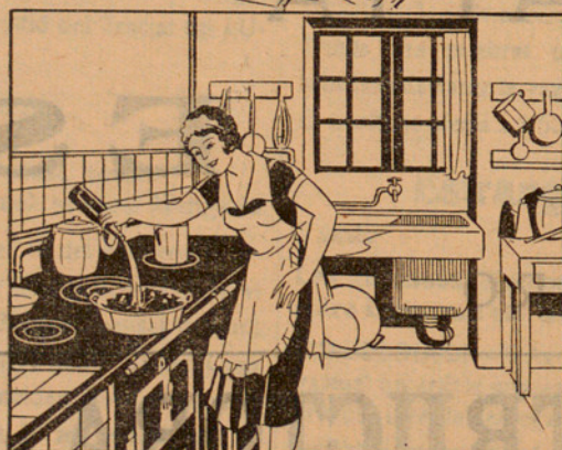
Amb la solució preparada mullo 15 quilos de carbó que abans hauré posat en un cubell, fins que quedi ben mullat. ¡Qüestió d'un minut!