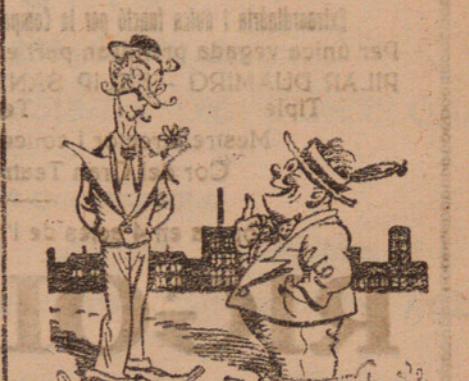
Figuri per aquest estiu Barret de palla amb ventilació. De Lustige Sachse, Leipzig.

La Biblioteca de la Societat Iris està oberta al públic els dies feiners, del dijous al divendres, de 8 a 10 de la nit; dissabtes, de 6 a 8 del vespre i diumenges, de 11 a 1 del matí i de 5 a 7 de la tarda.