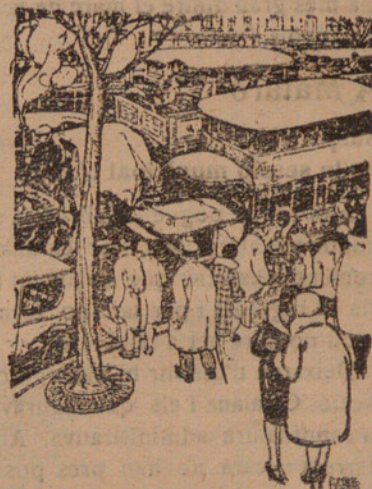
—Adeu, bufona, bona travessial De Passing Show , Londres.

Es incomprendible l'actitud de la premsa francesa. Volem creure que els