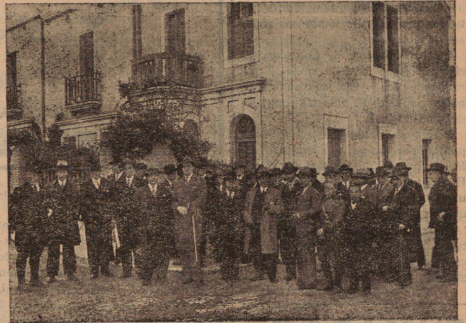
Els periodistes americans a Mataró amb les autoritats, representacions i periodistes locals, en la visita que feren a les Cases Barates.

Fa tota la feina del ram, per tots els procediments i amb presentació acurada.