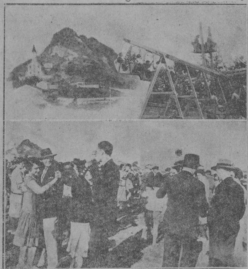
Unas notas de la animada romería celebrada el domingo en Peñacastillo.