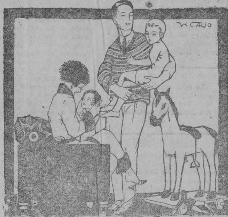
Si, hijo mío, si. Como a tu hermanito, cuando lo necesites, te purgaré con los deliciosos ROMBOS LAXANTES. Caja, 2 pesetas. Cajita de ensayo, 30 céntimos. En farmacias y droguerías.

Acciones: Banco de Bilbao, 1.875. Banco de Vizcaya, 1.300. Banco Urquijo Vascongado, 210. Banco Central, 90. Ferrocarril Madrid a Zaragoza y Alicante, 480. Electrica de Viesgo, 390. Hidroeléctrica Española, 170,50. Hidroeléctrica Ibérica, 450. Marítima Unión, 180. Papelera Española, 112. Unión Resinera Española, 154. Unión Española de Explosivos, 389. Obligaciones: Ferrocarril del Norte de España, primera, 71,90. Idem id. Valencianas, 5,50 por 100, 100,15. Idem Madrid, Zaragoza y Alicante, 6 por 100, J, 103,10. Hidroeléctrica Española, 6 por 100, 98,50. Constructora Naval, 5 por 100, 82. (Información facilitada por el BANCO DE SANTANDER.)