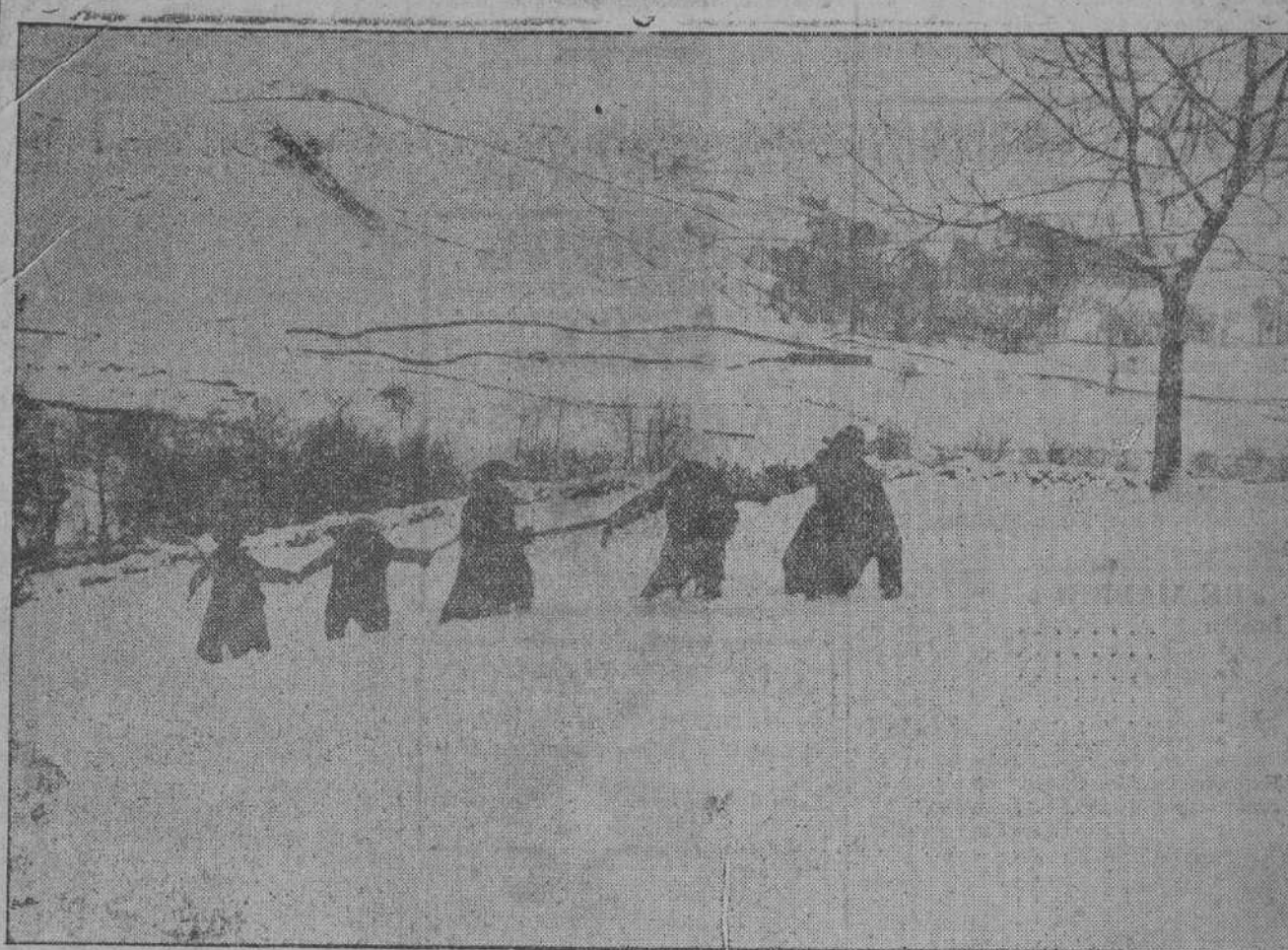
Las grandes nevadas de estos días han dado sobrado margen para que en nuestras montañas se practique el deporte de la nieve, como en los famosos lugares de Suiza.