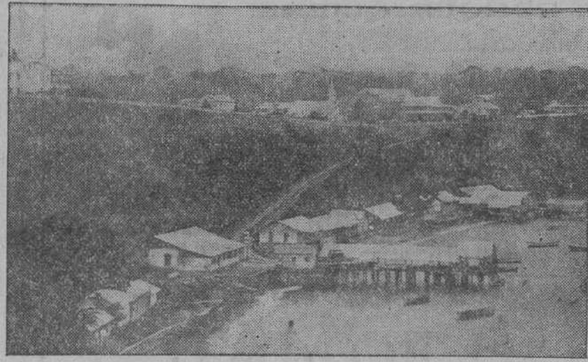
Vista parcial de la población de Santa Isabel (Fernando Pó).