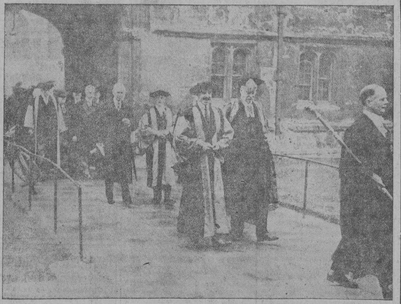
El Rey de España al salir de la Universidad de Oxford, después de recibir el título de doctor honoris causa. El Soberano, que viste la toga correspondiente, lleva en la mano el escrito de su nombramiento.

Este último desempeñará el papel de Napoleón y la artista española el de Josefina en una cinta reproduciendo la vida del héroe de Austerlitz.