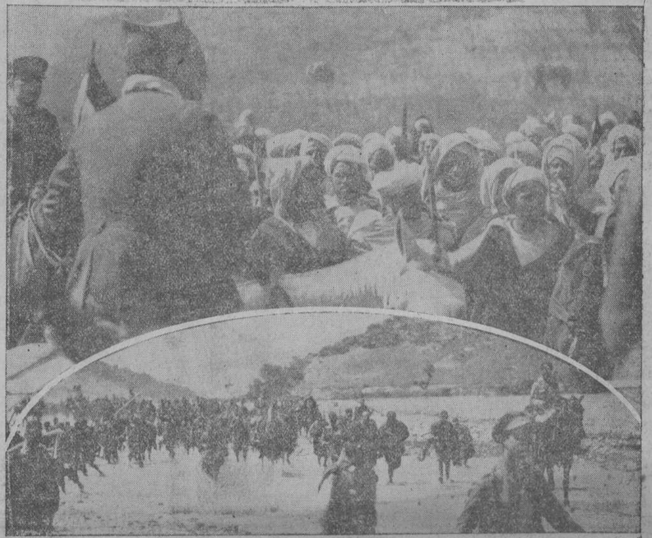
Los generales Sanjurjo y Castro Girona reciben la adhesión de todos los jefes de Beniurriague, la fracción más rebelde del Rif, mientras las columnas avanzan sin ser hostilizadas, como si se tratase de un paso militar en la Península.

Los morcos disidentes de Tazza y de Uazan creen que Abd-el-Krim no está prisionero. Lo que dice el parte oficial.