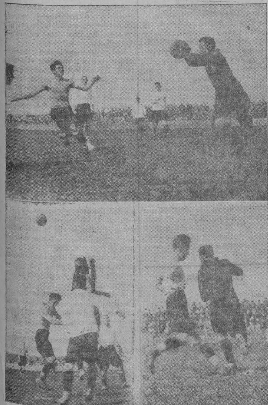
Tres momentos del partido Racing-Real Unión, celebrado el domingo.

A los comerciantes e industriales obligados a llevar el LIBRO DE VENTA les interesa leer el anuncio de la plana