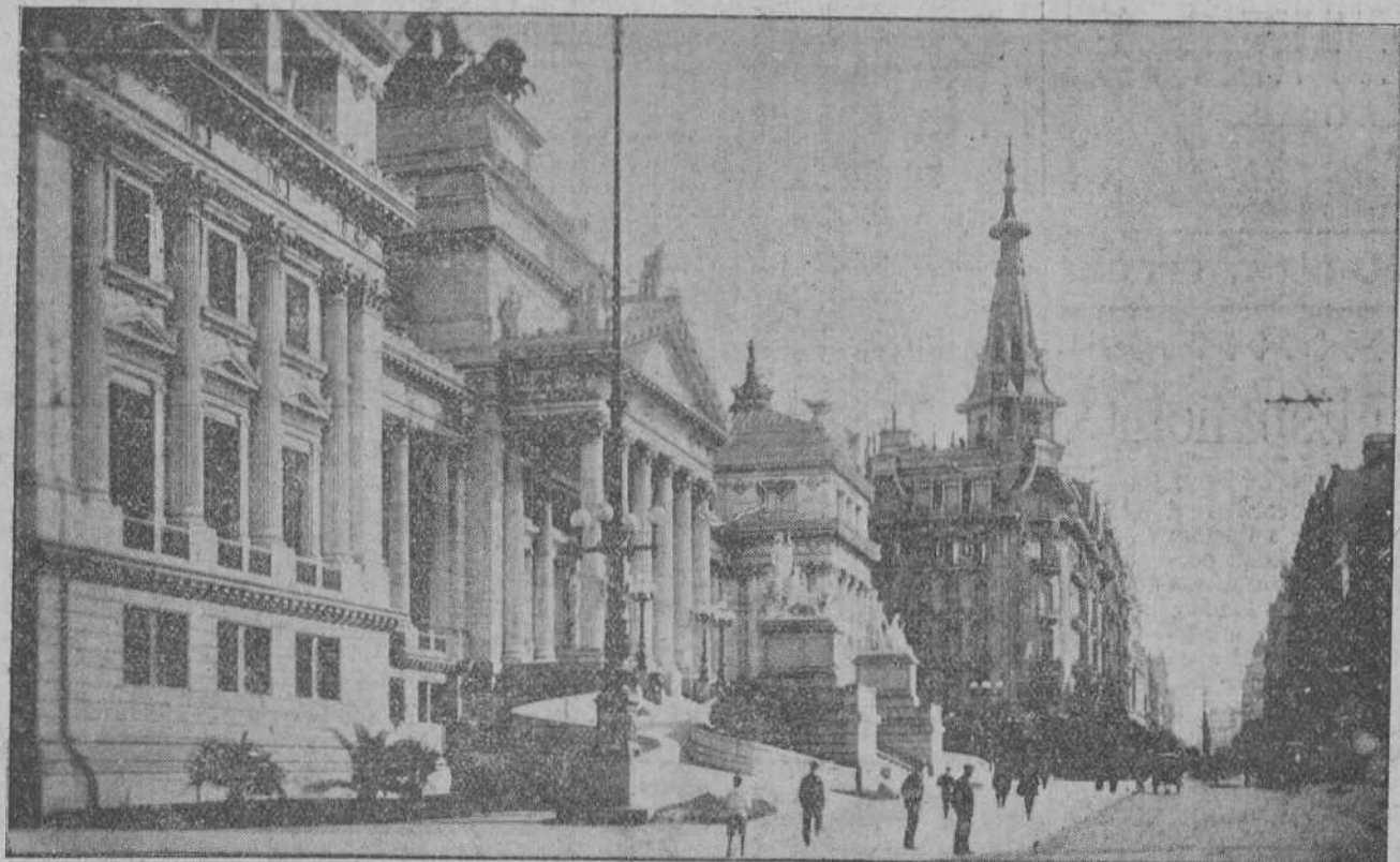
EL TERMINO DEL «RAID».—Congreso de Diputados y calle del Callao de la magnífica ciudad de Buenos Aires.

Se convoca a los señores socios de este Ateneo que simpaticen con el excursionismo asistan a la reunión que tendrá lugar en el Ateneo mañana, lunes, a las siete de la tarde.—La directiva.