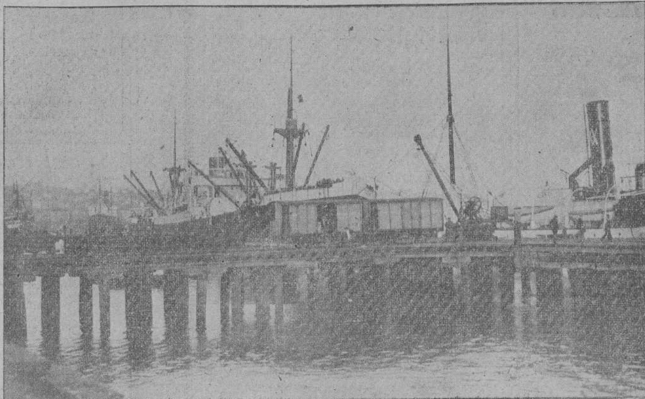
LA IMPORTANCIA DE NUESTRO PUERTO.—Aspecto que ofrecen los muelles de Maliaño, llenos de vapores, efectuando la descarga. Foto Samot).

Pero, preguntarán nuestros lectores, ¿barto sorprendidos, ¿es que en Santander no hay arena suficiente para construir un barrio, sino una enorme ciudad? No hay millones de toneladas de arena en el «Sable» de la bahía, en los arenales de Maliaño y en las playas del Sardinero? Claro que las hay. Pero las del «Sable» se han