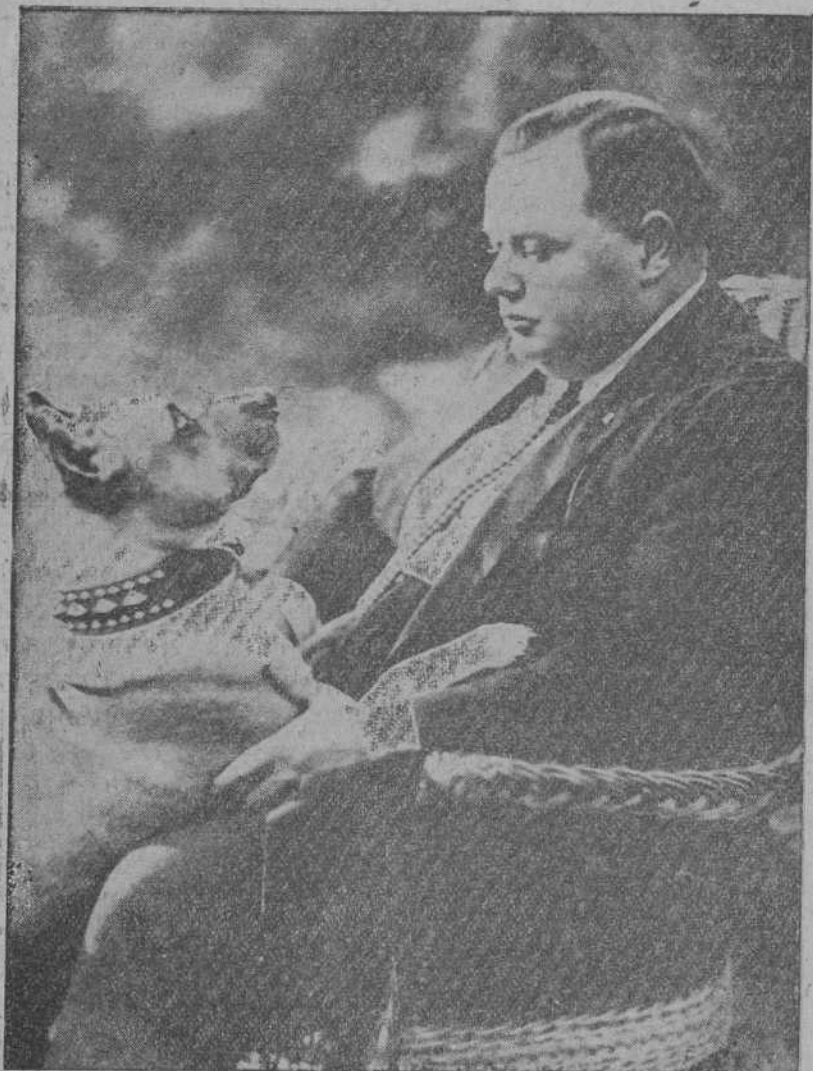
He aquí al simpático y gordo Fatty apostando con su perro a ver cuál de los dos pone la cara más seria.