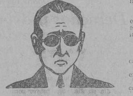
El tuberculoso lo ve todo negro.

«VERKOS» Instituto Biológico Internacional S. A. SAN SEBASTIAN