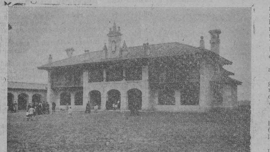
LOS CORRALES.—El magnifico Asilo de San José, construido también a expensas de la señora condesa de Forjas de Buena, inaugurado ayer mañana.

A continuación se trasladó en automóvil a Palacio.