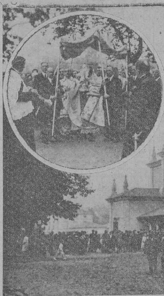
La nueva iglesia de San Vicente (proyecto del malogrado arquitecto señor Rucabado), inaugurada ayer mañana en Los Corrales.—En el círculo, el Sr. Obispo trasladando el Santísimo a la nueva parroquia.

«Madrid.—Presidente interino Directorio. Ruególe acepte entusiástica felicitación pueblo Santander conmovido brillante jornada Ejército Africa digno del caudillo que le guía.