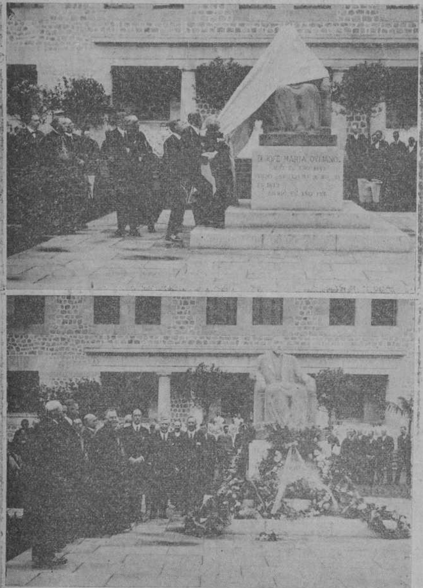
LOS CORRALES.—Momento de descubrir la estatua del fundador de las Forjas de Buelna.—Su ilustísima pronunciando un discurso en el solemne acto.