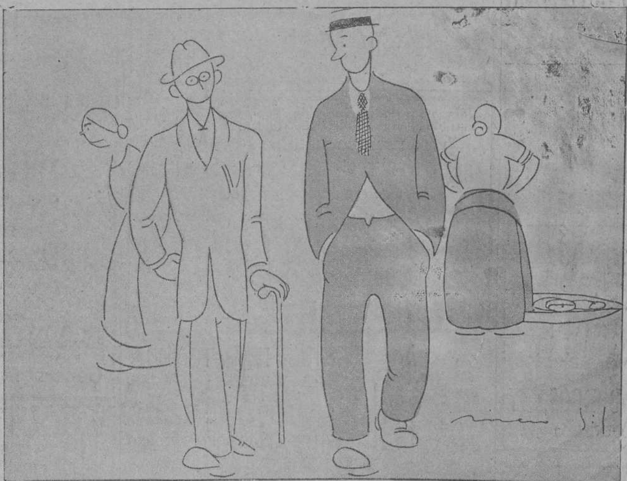
—EN RESUMEN: ¿ES «LA MALCASADA» O LA MAL SACADA?