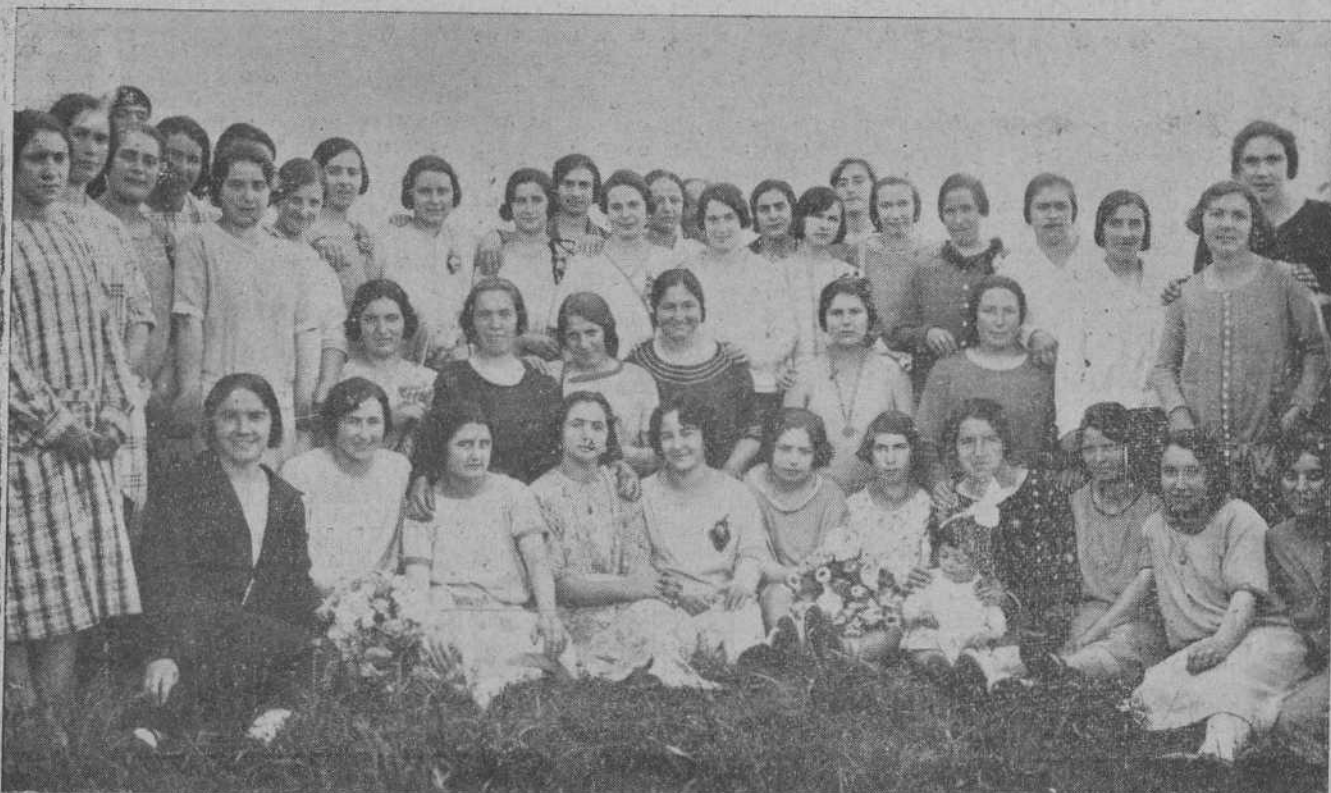
GRUPO DE ENCANTADORAS JOVENES QUE ASISTIERON DIAS PASADOS A LA ANIMADA ROMERIA CELEBRADA EN CAYON

Hemos tenido mucho gusto en acudir a nuestro querido amigo don Pe-