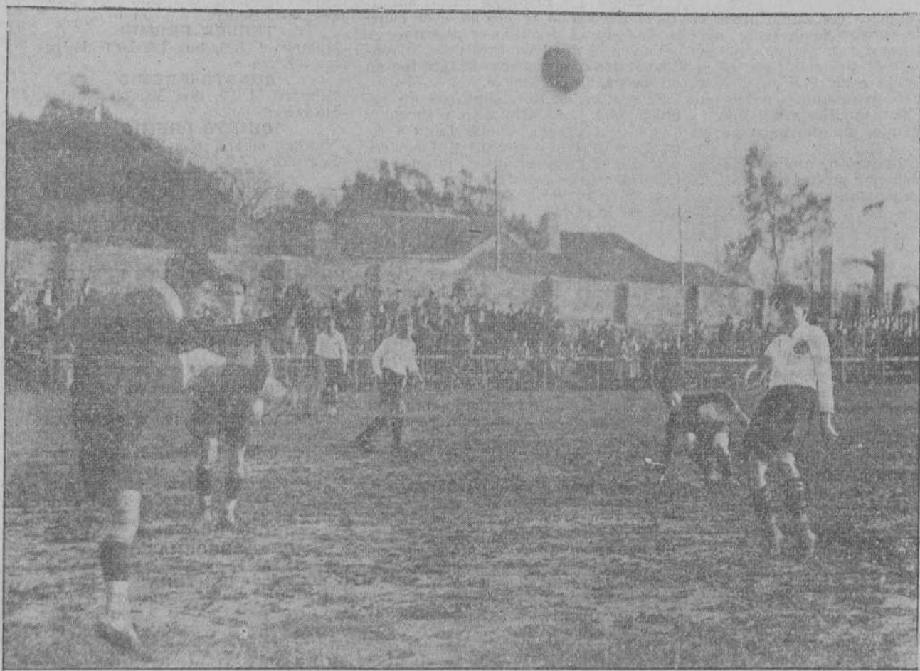
UN MOMENTO DEL PARTIDO RACING-UNION MONTANESA, CELEBRADO EL DOMINGO EN MIRAMAR