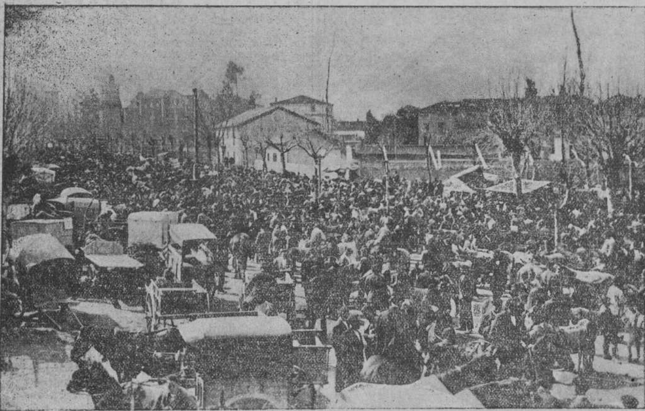
TORRELAVEGA.—ASPECTO QUE OFRECIA EL FERIA EL PASA DO DOMINGO

Cuanto ahora se habilita, claro está que se hace con carácter provisional, ya que persiste el deseo y la necesidad de construcción de un nuevo edificio.