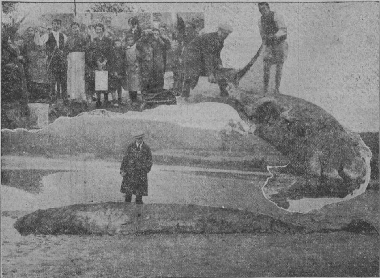
EN LA RIA DE AJO.—EL CETACEO APARECIDO EL MIÉRCOLES, VISTO DE FRENTE Y DE COSTADO.—EN EL ANGULO, UN GRUPO DE VECINOS DE AJO, PORTADORES DE LATAS LLENAS DE GRASA DEL CETACEO.

En las primeras horas de la tarde de ayer llegaron a nosotros rumores de que en la ría de Ajo había aparecido un enorme cetáceo, de unos 12 metros aproximadamente de longitud.