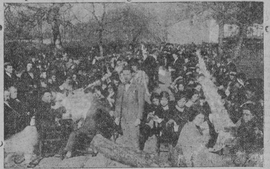
Una boda celebrada en Bárcena de Toranzo.

Dr. Vega Trápaga MÉDICO ESPECIALISTA Enfermedades de la piel y secretas, Consulta de 11 a 1 y de 4 a 6. MENEZ NUÑEZ, 7, 2.º