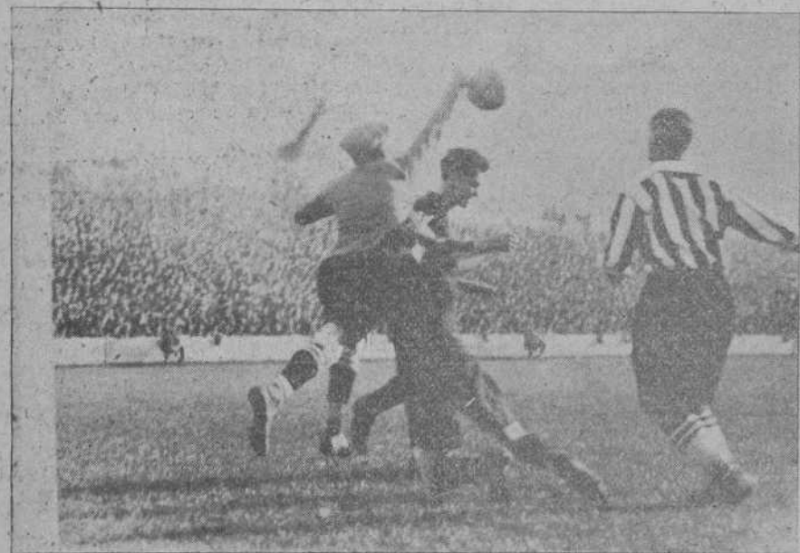
BILBAO-Arenas-Athletic.—Vidal despeja en un ataque de los areneros.