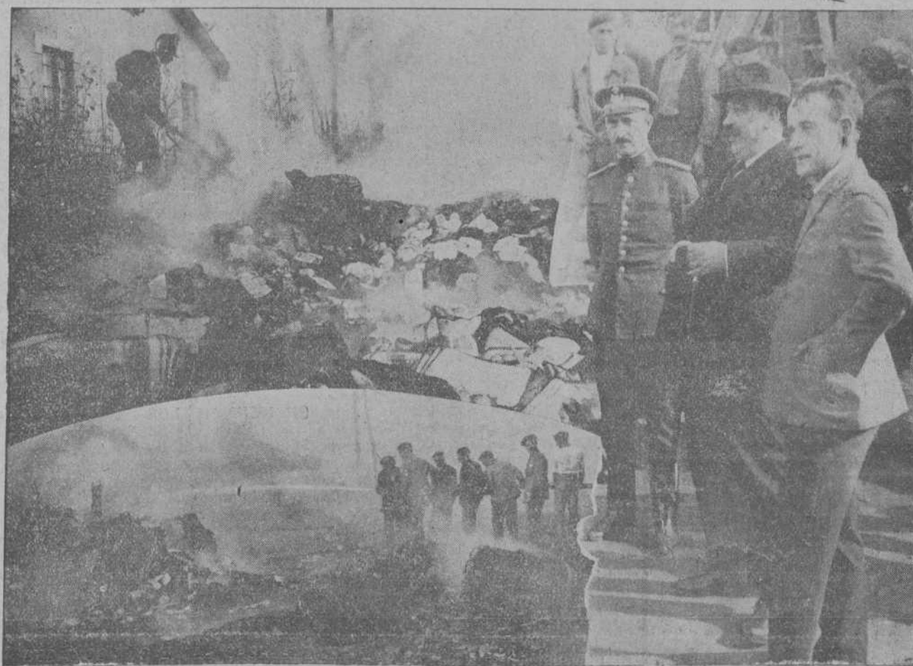
DEL INCENDIO EN LA CASA ALDUS.—El gobernador presenciando los trabajos de extinción.

Seguidamente Su Majestad el Rey declaró abierto el Congreso, retirándose, y una vez constituidas las secciones y señalados los planes de trabajos, se suspendió la sesión.