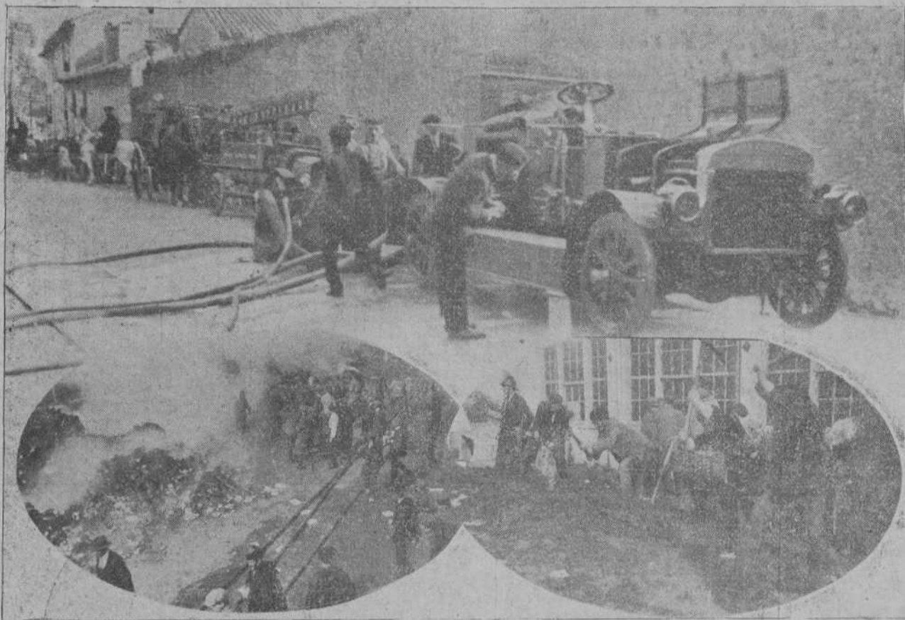
DEL INCENDIO EN LA CASA ALDUS.—El material de los bomberos funcionando.—Dos momentos de los trabajos de extinción.