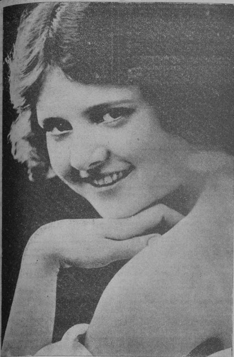
CONSTANCE BINNEY, preciosa estrella que cada día obtiene más popularidad en el mundo del celuloide por su brillante actuación y singular belleza.

«Naturalmente; yo espero volver al teatro algún día, pasados los treinta—nos dijo con una sincera sonrisa—. La juventud quiero aprovecharla en las películas. La tradición cinematográfica exige que las estrellas respalden de juventud y que se mantengan jóvenes tanto tiempo como desempeñen tal categoría. En el teatro es distinto. Ningún artista espera alcanzar la cumbre hasta pasada la treintena. Para desempeñar papeles de primera es necesario tal avance en años pero si lo es para «conservarse» actriz plena. Yo estoy contenta por haberme retirado de las