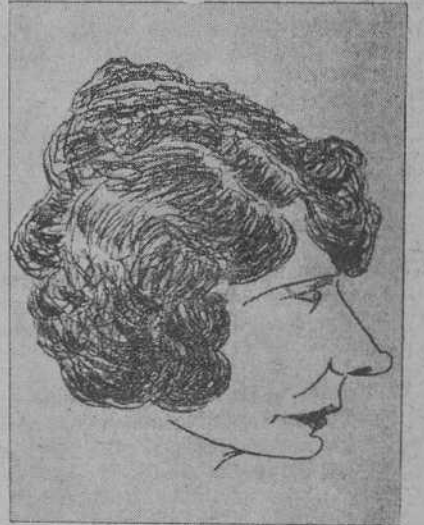
¿A qué actriz cinematográfica pertenece esta caricatura?

«Quiero tanto a mi caballo—dice— que no lo cambiaría ni por una torre de marfil».