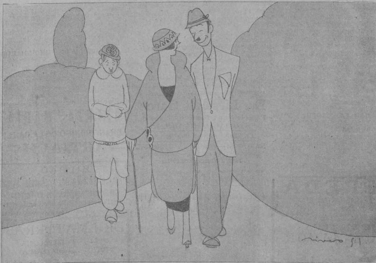
—¿Lo que son las paradojas! Si por fin os movilizan a las mujeres, ya puedes ir pensando en prescindir de la «carabina».