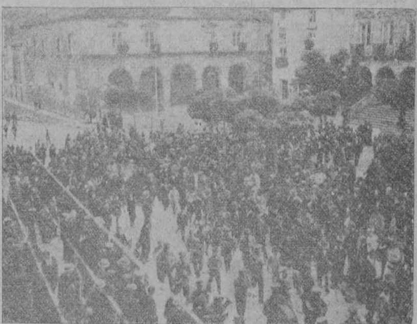
ENTUSIASMO EN SORIA. —MANIFESTACION EN LA VIEJA CIUDAD CASTELLANA DE TODAS LAS CLASES SOCIALES, QUIENES SE DIRIGIERON AL GOBIERNO CIVIL PARA ENVIAR TELEGRAMAS DE GRACIA A SU MAJESTAD EL REY Y A LOS PODERES PUBLICOS POR EL FELIZ TERMINO DEL ASUNTO DEL FERROCARRIL ONTANEDA-CALATAYUD.

Dr. Solís Cagigal VÍAS URINARIAS, SECRETAS, DIATERMIA Moderno tratamiento de la blenorragia y sus complicaciones. Consulta de 11 a 1 y de 3 a 4 y media SAN JOSE, 11, HOTEL