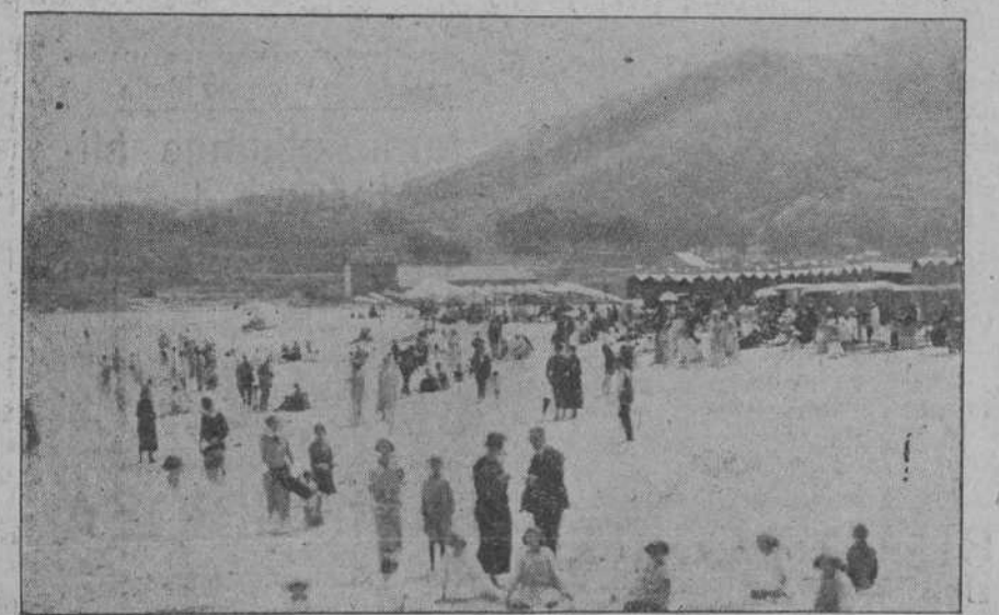
CASTRO URDIALES.—Las casetas de la playa.

—En el Municipio de Val de la Peña serán recibidos tres presuntos delos de esta provincia.