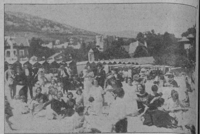
CASTRO URDIALES.—La playa a la hora del baño.

Con fecha 10 de agosto apareció en el pórtico de la iglesia un edicto por el que el Ayuntamiento anunciaba que se iba a proceder a incluir en el presupuesto de gastos los que ocasionaba el alquiler de la casa-cuartel de la Guardia civil y sus anexos, interesante de que los vecinos que no estuviesen conformes podían hacer sus reclamaciones en el término de ocho días. Al enterarse de esto la mayoría de los vecinos elevaron un escrito respetuoso, suscrito por 117 vecinos de los 147 que componen el total, protestando que se incluya en el presupuesto de gastos dicha cantidad, dados los