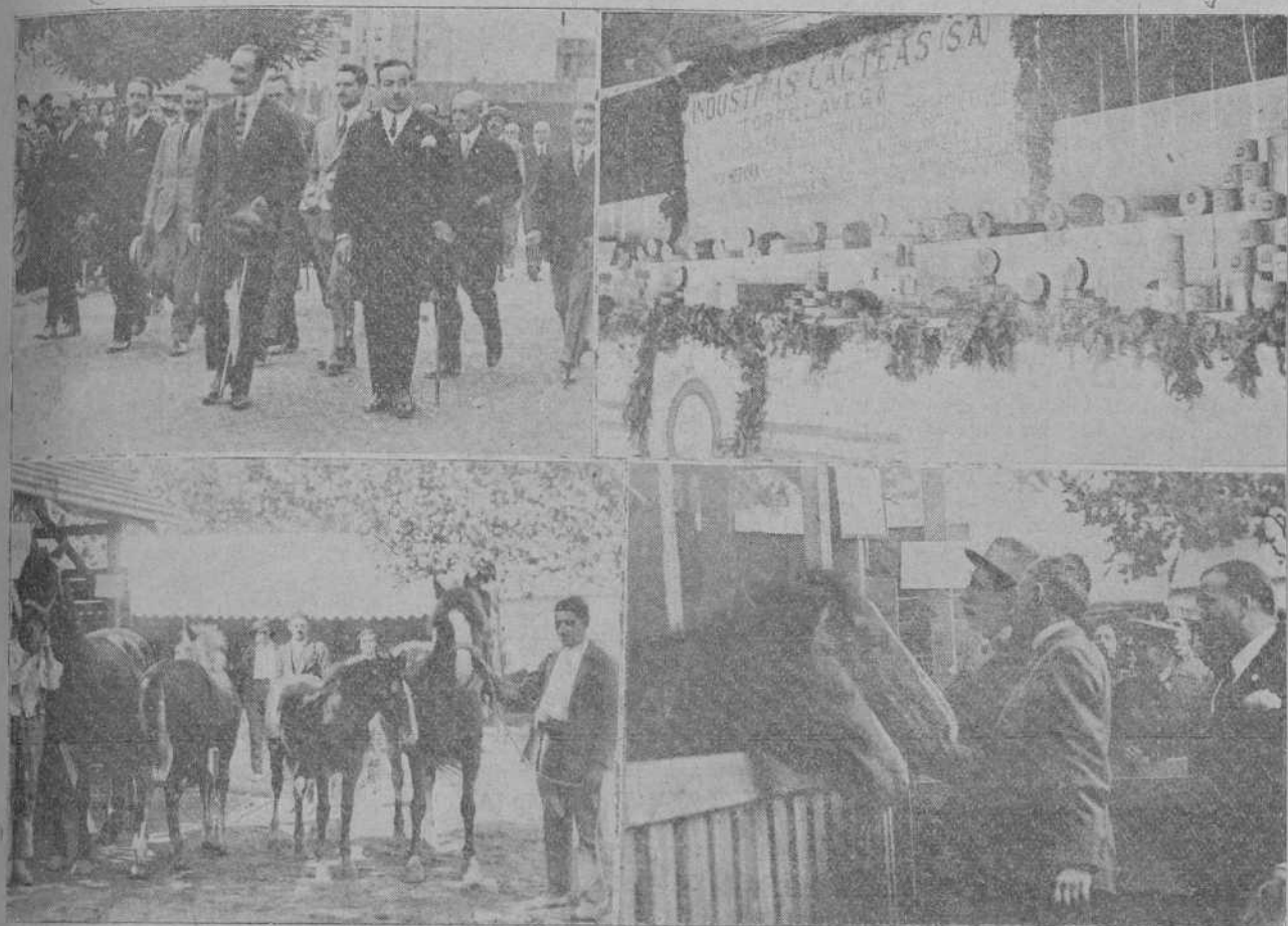
EL CONCURSO AGRO-PECUARIO.—Su Majestad el Rey visitando las instalaciones Montañesas.—Dos detalles de la Exposición.