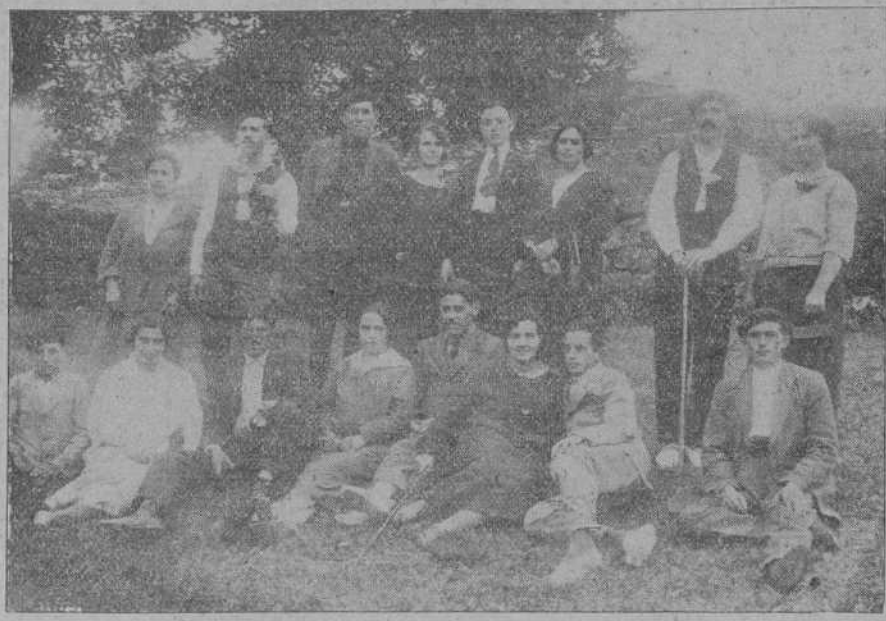
CORVERA DE TORANZO.—GRUPO DE JOVENES EXCURSIONISTAS QUE FUERON A ALCEDA CON MOTIVO DE LA ROMERIA DE SAN PEDRO.

El deporte de los bolos. El juego montañés por excelencia, se está practicando con enorme entusiasmo por los aficionados del quehacer. El interés de los concursos mensuales organizados por la Unión Bolística, ha sido elevado al sumum, merced a un valiosísimo donativo de una Austre personalidad. Es ésta, el excelentísimo señor presidente de la Diputación y caballero de mérito don Juan Ruiz de Villa.