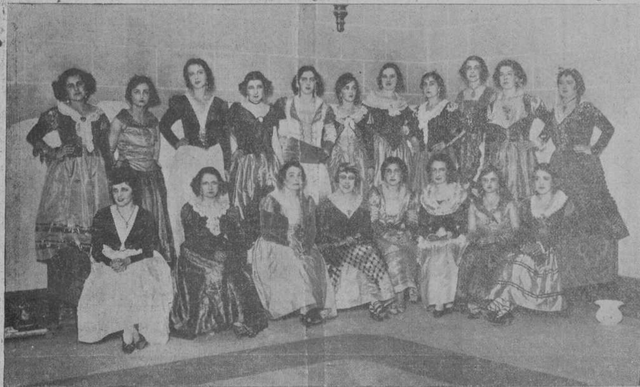
Las bellas y aristocráticas señoritas que tomaron parte en la magnífica función verificada anoche en el Teatro Pereda.

LEAFIELD.—Se está celebrando importantes preparativos para la recepción de los Reyes de Italia. El Ayuntamiento de Londres ofrecerá a los regios huéspedes un banquete, al que asistirán las más distinguidas personalidades londinenses, entre las que se cuentan el príncipe de Gales, los duques de York y de Devon, los miembros de la Familia Real inglesa, y el primer ministro y demás miembros del Gobierno. La salutación de bienvenida les será ofrecida a los Reyes de Italia en un cofrecito de oro.