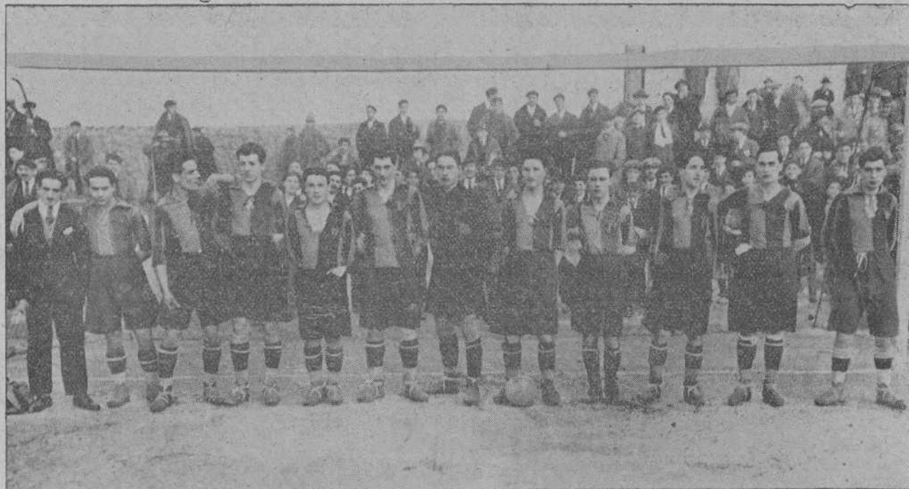
EL EQUIPO DE «LA UNIÓN MONTAÑESA», PERTENECIENTE A LA SERIE A.