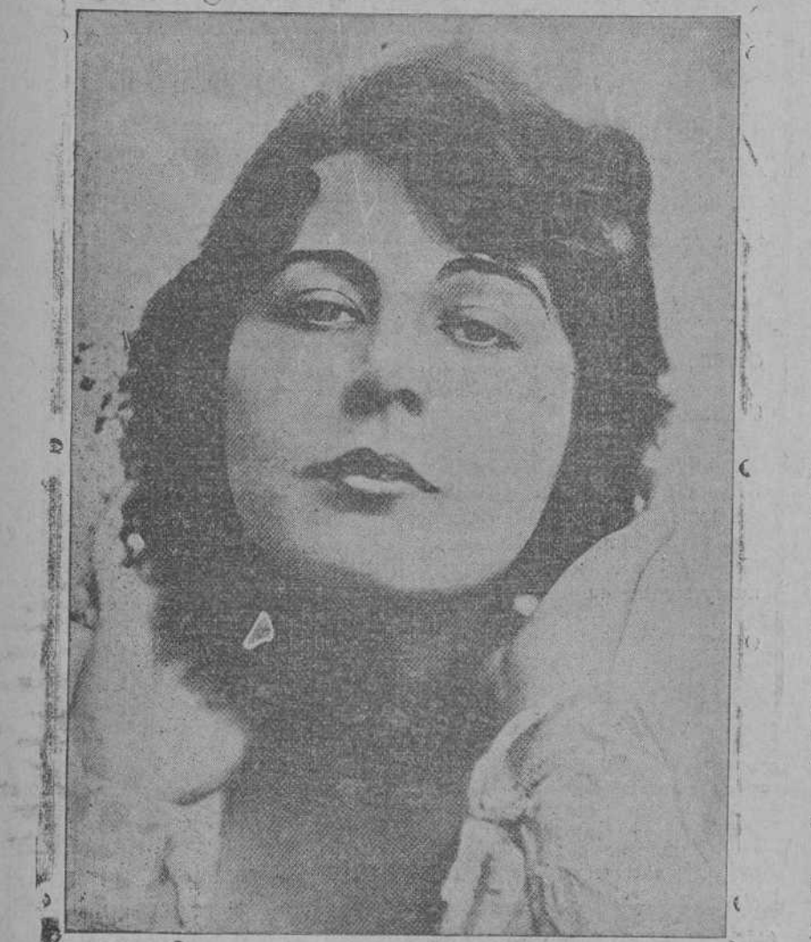
DOROTHY DALTON, FAMOSA Y BELLÍSIMA «ESTRELLA» DE LA PARAMOUNT