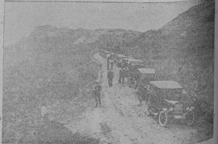
Los autos que formaron la caravana que fué el último sábado a la Bien Aparecida.