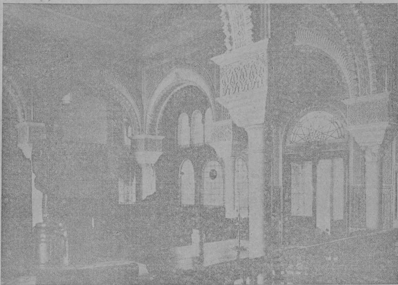
Detalle del elegante y artístico «hall» del nuevo trasatlántico «Alonso XIII».

Las indagaciones practicadas en estos últimos días para dar con el