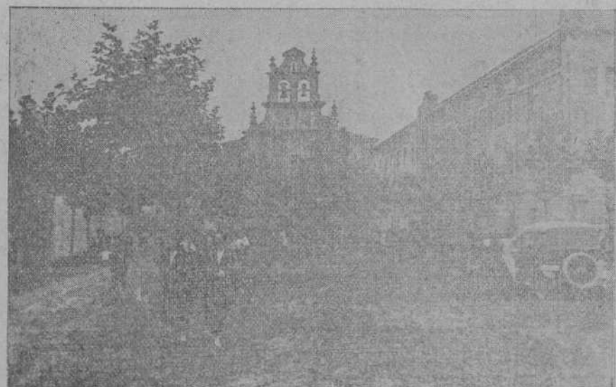
Aspecto del Santuario de la Bien Aparecida durante la jira del sábado.

Las pérdidas son de muy poca importancia, de lo cual nos congratulamos sinceramente.