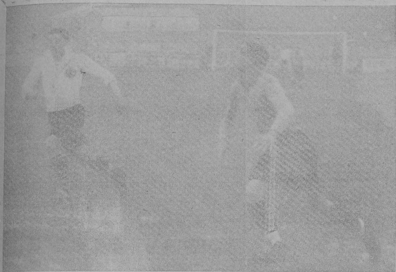
Un momento del encuentro Racing—Esperanza con que se inauguró la temporada en los Campos de Sport.

Hoy, a las ocho, se celebrará una reunión de ciclistas en nuestra Redacción.