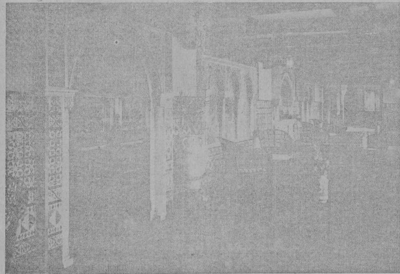
Galería de invierno del Alfonso XIII.