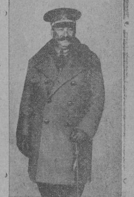
El ilustre ex alto comisario de España en Marruecos, general Berenguer.