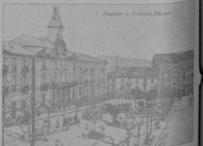
PCBLACIONES MONTAÑESAS.—Vista parcial del espacioso Boulevard de Demetrio Herrero, de Torrelavega.