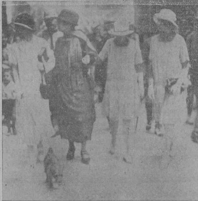
Sus altezas las infantas doña Beatriz y doña Cristina pasaron ayer por la población, haciendo compras en algunos comercios.

Sin embargo, «Calla, corazón!», es una pieza hecha artificialmente, con tipos, escenas y recursos del viejo y absurdo teatro del gran Echegaray y con una muy notable falta de técnica. Se observan estos defectos desde el final del primer acto al término de