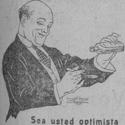
Sea usted optimista

y en vez de lamentarse de su debilidad, agotamiento y vejez prematura, reconstituya su naturaleza achacosa, pues por grave que sea la anemia que padece, puede usted recuperar la vitalidad y gozar de nuevas energías, tomando el poderoso jarabe de