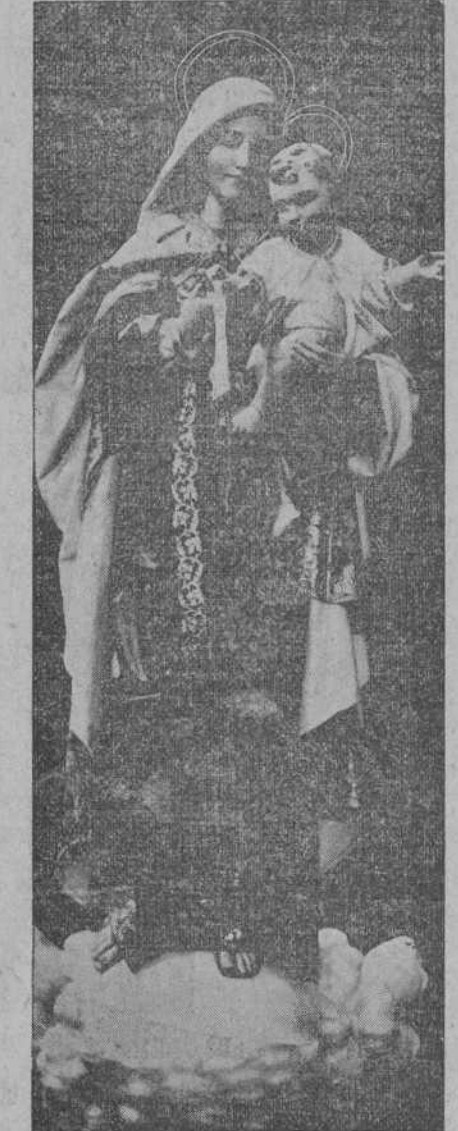
La imagen de Nuestra Señora del Carmen, que salió por primera vez en la procesión verificada anteayer.

Sin embargo, a Santander vendrá una lucida representación de su eminenencia ilustrísima.