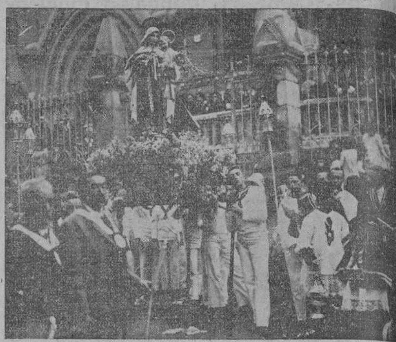
La patrona de los marinos llevada a en hombros por éstos en la procesión del lunes.

Real Congregación del Alumbrado y Vela al Santísimo Sacramento, Real Hermandad Sacramental y Milicia Cristiana, Orden Tercera Franciscana, banda municipal, religiosos: Clero parroquial, Tribunal Eclesiástico, Clero Catedral, eminentísimo señor cardenal y excelentísimo señor obispo, ilustrísimo Ayuntamiento, autoridades, banda militar y fuerzas militares,