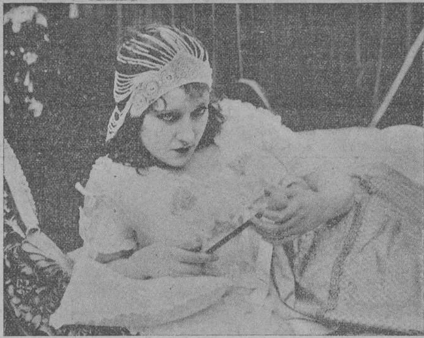
LA CONOCIDA Y NOTABLE ESTRELLA DEL TEATRO MUDO GLORIA SWANSON