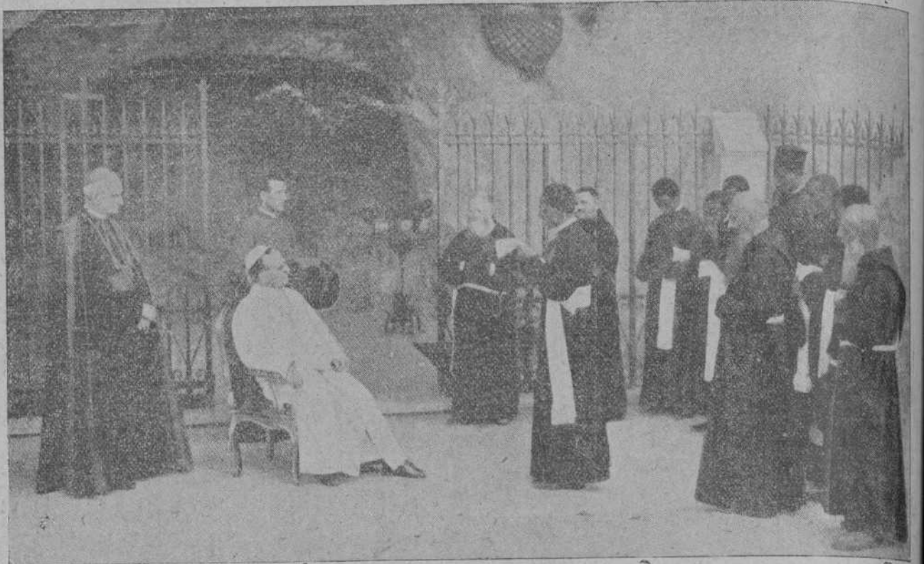
UNA INFORMACION GRAFICA INTERESANTE.—Pío XI recibe a los alumnos del Colegio Etiópico, en los jardines del Vaticano.

A propósito de esta última sátira, advierto a mis impugnadores que, una cosa es Teología u Obstetricia y otra Ginecología, y que, si se habiesen tomado la molestia de quemarse las pestañas, como yo, encima de