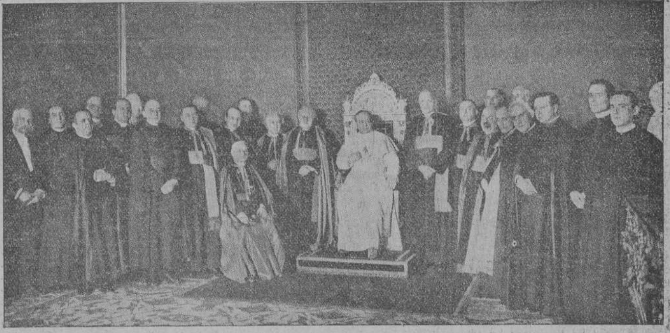
UNA INFORMACION GRAFICA INTERESANTE.—Su Santidad el Papa, rodeado de los miembros del Consejo Superior de la Propagación de la Fé.

El Comité de huelga ha lanzado una hoja tratando con gran dureza a las autoridades y a la Prensa local. El día va transcurriendo sin incidentes.