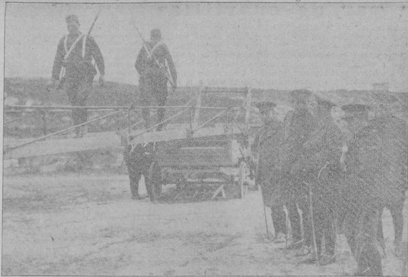
MADRID.—MANIOBRAS MILITARES EN RETAMARES.—SU MAJESTAD EL REY VIENDO UN PUENTE CONSTRUIDO POR LOS INGENIEROS, CON LOS NUEVOS APARATOS ADQUIRIDOS RECIENTEMENTE.

Uno de los detenidos en Manresa, con motivo del suceso del bar «La