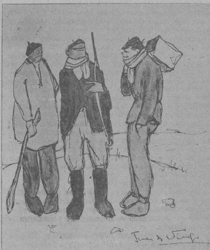
UNO DE ELLOS, EL MÁS TORNIDO Y RECIO DE TODOS...

gada, menos su jefe que llevaba gorra de prolongada visera, y calzados con burdos escarpines de sayal y recias almadrénas llevaban sujeto a la cintura o pendiente del hombro el pañuelo de picos atados o el morralillo con la merienda y en la mano un aguzado y flexible palo de avellano para ayudarse en la penosa marcha. Algunos, los menos, portaban escopeta. Otros iban armados de chuzos o de pequeñas hachas. Quien, llevaba