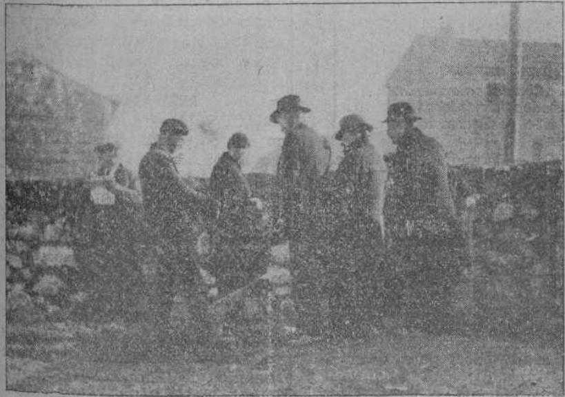
EL JUZGADO Y EL MEDICO FORENSE DURANTE LAS DILIGENCIAS PRACTICADAS EN LA MAÑANA DE AYER EN EL BARRIO DE CAZOÑA

Por nuestra parte procuraremos enterar a nuestros lectores en el número de mañana de alguna novedad, si la hubiere, en este asunto, que parece va tocando a su fin.