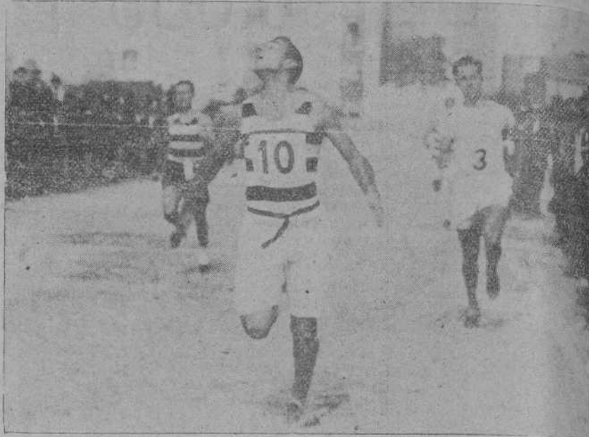
MADRID.—EL GANADOR DE LA CARRERA DE CUATROCIENTOS METROS EN EL MOMENTO DE ENTRAR EN LA META