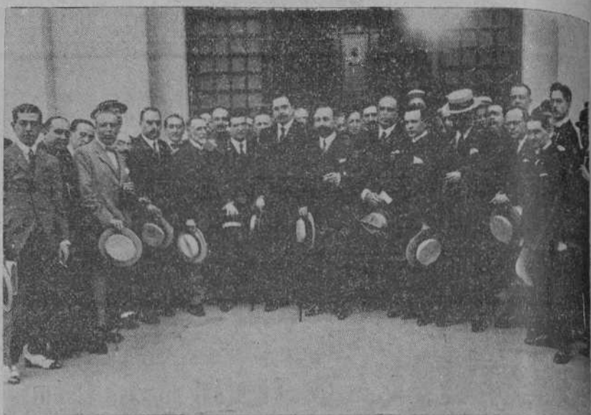
LA ASAMBLEA DE LA PRENSA.—Las autoridades y los asambleístas al terminar la sesión de clausura, verificada ayer.

Rogamos a cuantos tengan que dirigirse a este periódico, que hagan constar el número de nuestro Apellido, que es el 62.