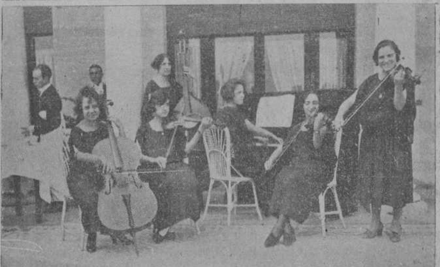
Aspecto que ofrecía ayer la terraza Sur del hotel Real durante el banquete con que la Asociación de la Prensa de Santander obsequió a sus compañeros de provincias.—El notable sexteto de señoritas que interpretó bellas composiciones durante el banquete.