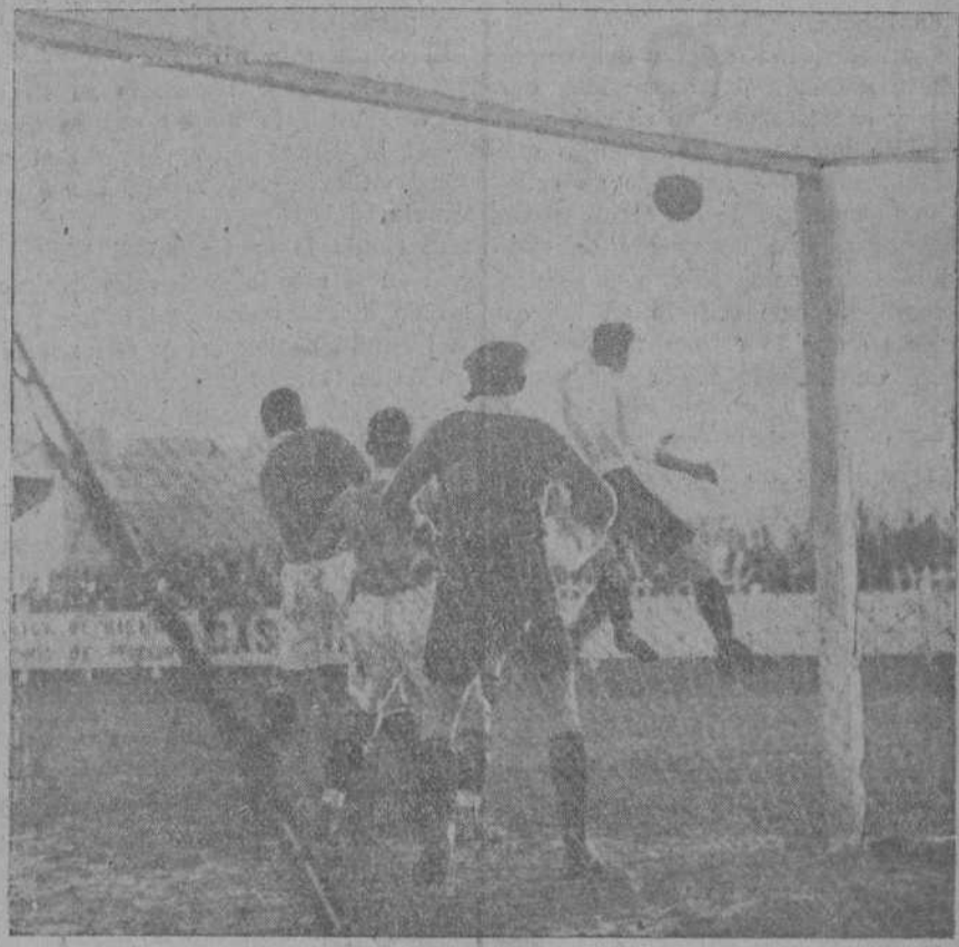
DEL PARTIDO DE AYER.—Un momento de compromiso ante la meta alemana.

La desnaturalizada madre ingresó en la cárcel por orden del Juzgado municipal de aquel partido.