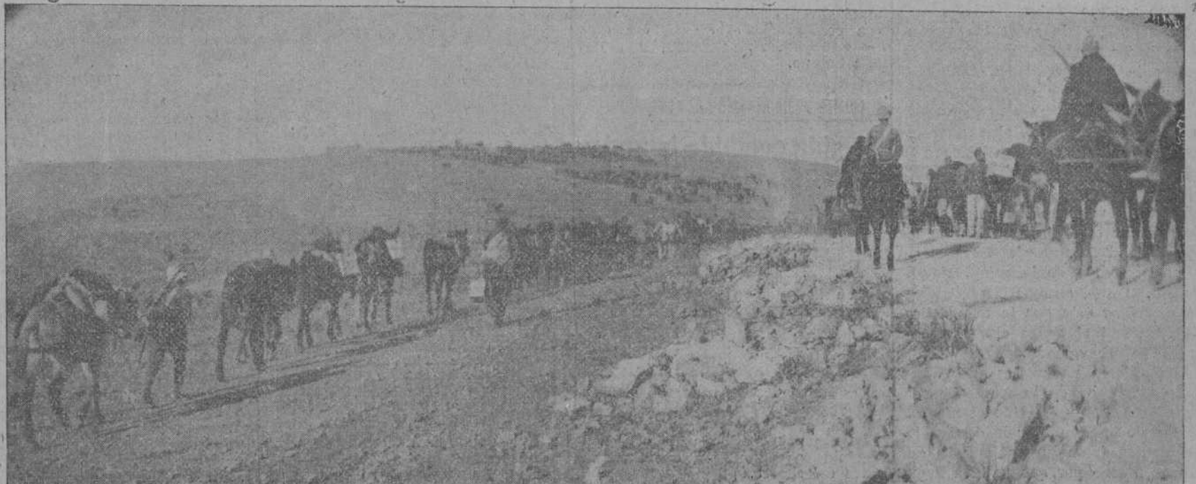
MELILLA.—COLUMNA ESPANOLA AVANZANDO HACIA KALCU.