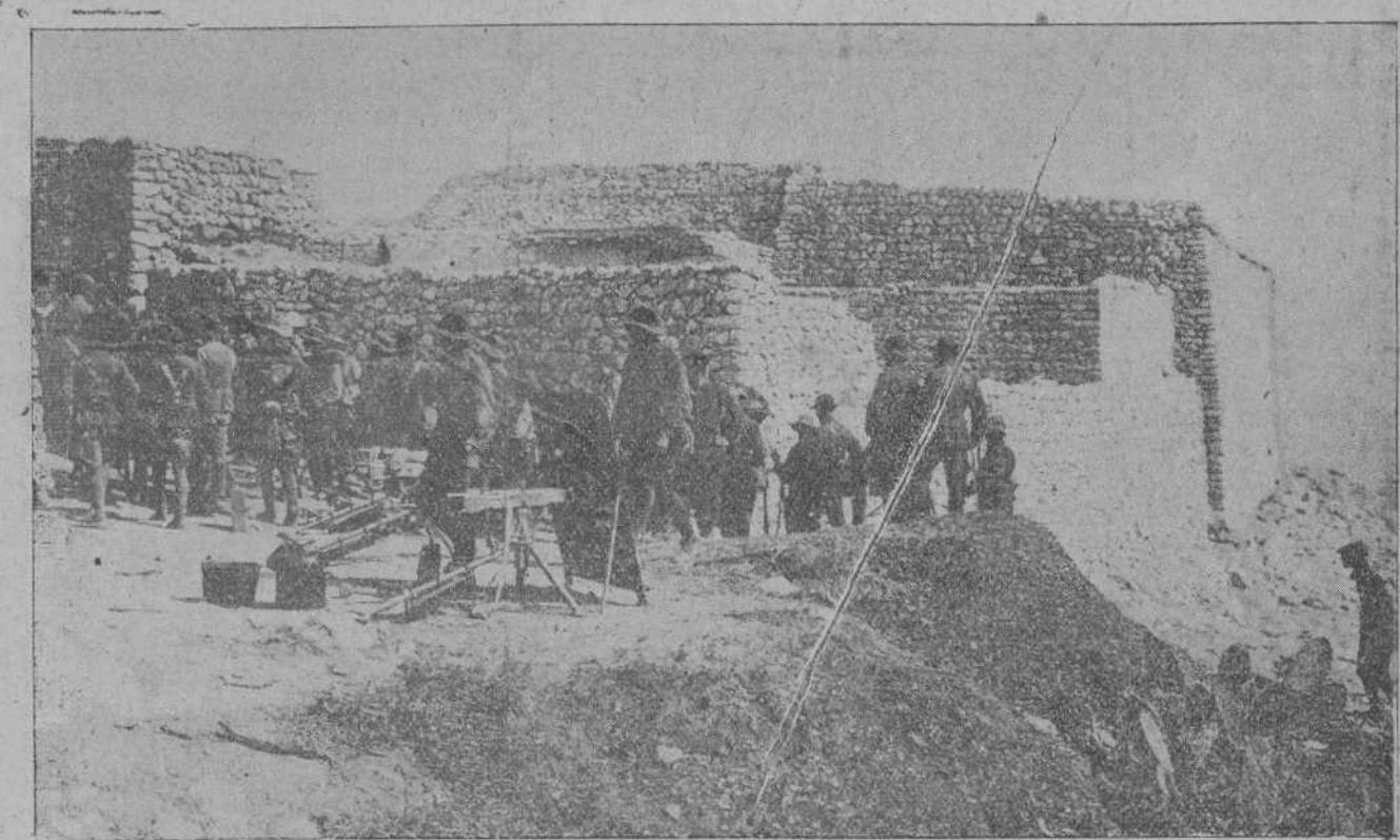
LOS SOLDADOS DEL BATALLÓN DE VALENCIA ENTRANDO EN UNA DE LAS POSICIONES TOMADAS ULTIMAMENTE.

Añadió que la actitud del Gobierno es opuesta a la vuelta del ex Emperador Carlos.