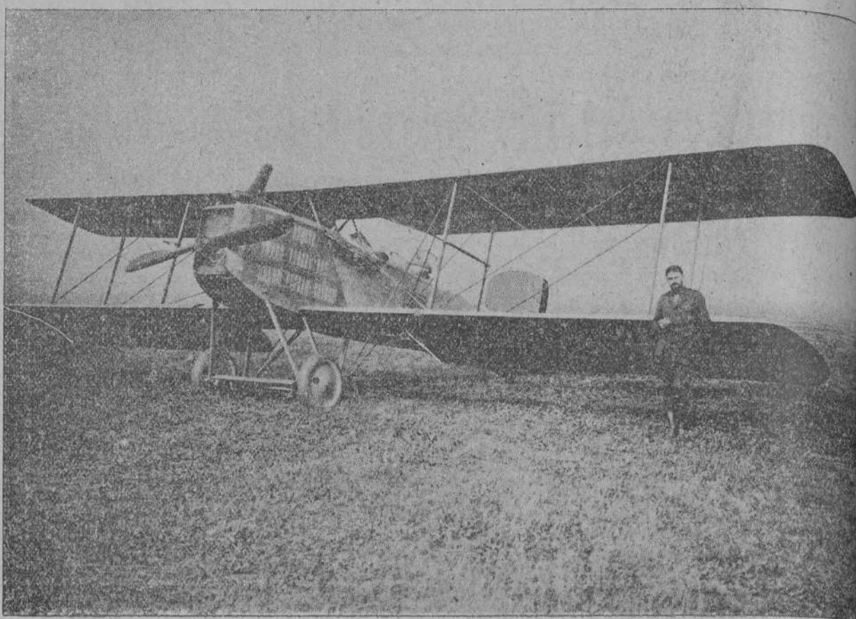
EL MAGNIFICO AEROPLANO QUE LA MONTAÑA REGALA AL EJERCITO DE OPERACIONES EN AFRICA

En el tren mixto de Madrid partirán para aquel venerando Santuario, de tanta devoción en nuestra provincia, muy crecido número de fieles de la capital, entre ellos muchos hombres, e irán aumentando considerablemente en las estaciones del tránsito, habiendo de ser crecidísimo el contingente a la llegada, según se desprende de la lista de inscripciones. Pero, con ser tantos, fuera del cálculo de los organizadores, representan una pequeña parte de los que se han de postrar ante la bendita imagen de Nuestra Señora, concurrencia enorme que con el rezo del Santo Rosario han de conseguir los piadosos fines que allí los lleva.