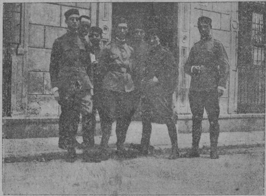
EN ALMERIA.—Conocidos soldados del batallón expedicionario de Valencia, a la puerta del Hotel Continental, el día antes de su marcha a Melilla.

Hace algunos años, según las crónicas del lugar, no sabemos si muy dignas de fe, sobre los muros de gran número de casas de los barrios más céntricos de la capital polaca, apareció un manifiesto que decía así: «La Asociación de ladrones de Polonia advierte que sus propios socios piensan abandonar la profesión, consintiendo a ello por los excesivos tri-