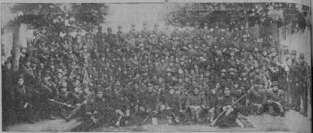
LA TERCERA COMPANIA DEL BATALLON EXPEDICIONARIO EL REGIMIENTO DE VALENCIA

Hoy están citados por el general gobernador los distintos Cuerpos del Ejército, para comunicarles la patriótica suscripción que lleva a efecto Santander, por iniciativa de su alcalde, y con objeto de que contribuyan a engrosarla en la medida de sus fuerzas.