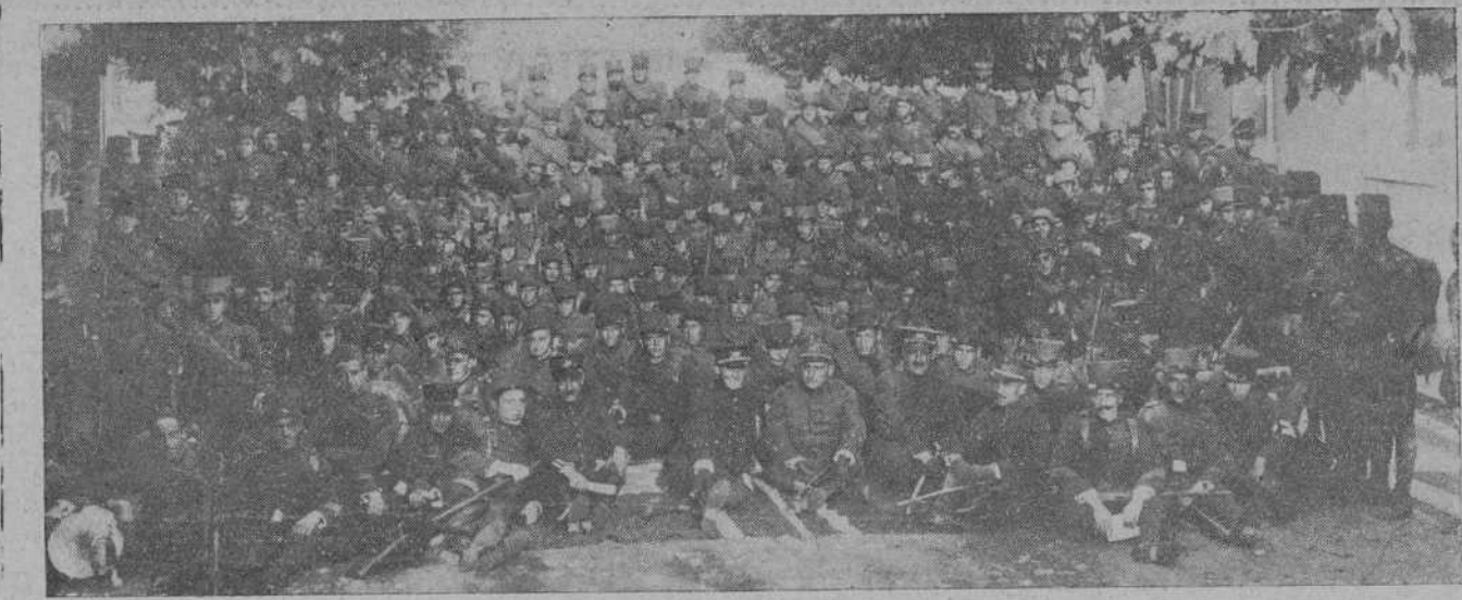
LA SEGUNDA COMPANIA DEL BATALLON EXPEDICIONARIO DE VALENCIA.

EL CONDE DE HORNACHUELOS CADIZ, 13.—La familia del conde de Hornachuelos puede asegurar que éste se halla vivo y en poder de los moros que le hicieron prisionero en Monte Arruit, en la defensa de cuya posición tomó parte.