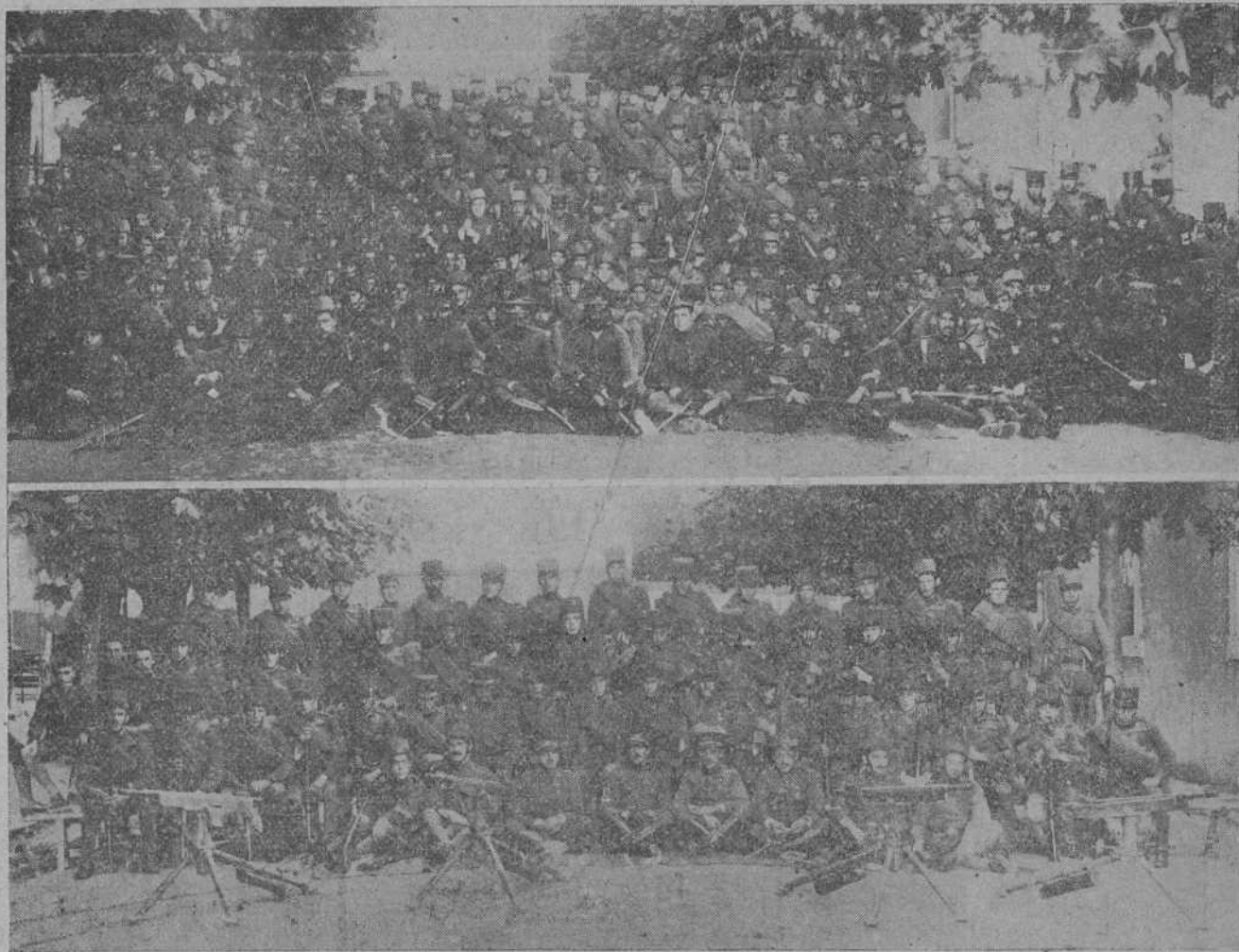
LA CUARTA COMPANIA DEL BATAILLON EXPEDICIONARIO DEL REGIMIENTO DE VALENCIA Y LA DE AMETRALLADORAS DEL MISMO.

Si no hiciesen tanto daño al país, sería cosa de emplearlos como número para la atracción de forasteros y el fomento del turismo.