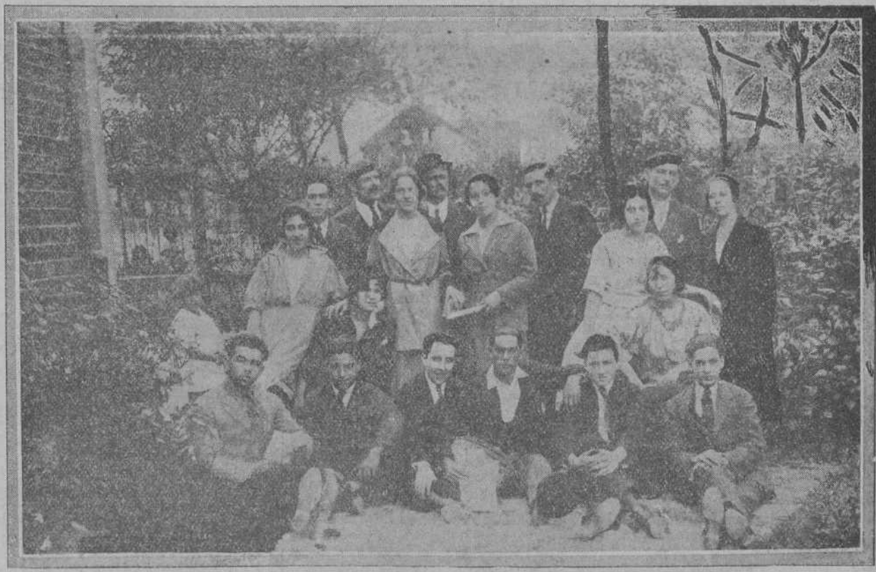
GRUPO DE SEÑORITAS Y JOVENES QUE FORMAN LA AGRUPACION ARTISTICA, DE BARREDA, A LA QUE NOS REFERIMOS EN OTRO LUGAR DE ESTE NUMERO.

MADRID, 21.—El señor marqués de Estella continúa enfermo, mostrándose los médicos inquietos, habida cuenta de la avanzada edad del ilustre general.